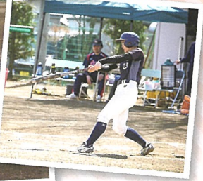
※写真は現在のソフトボール部のものです。